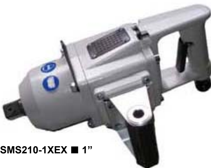
SMS210-1XEX ■ 1”