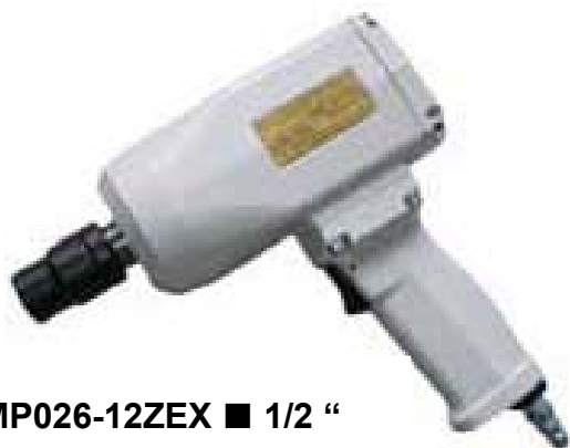
SMP026-12ZEX ■ 1/2 “