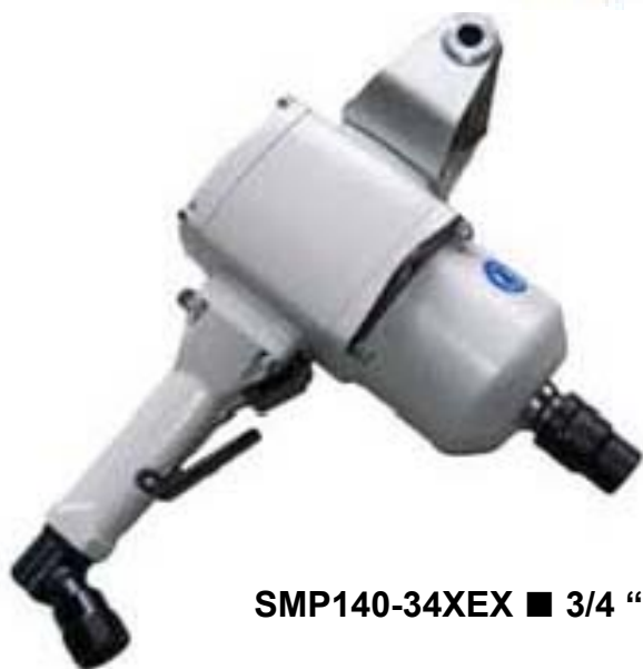
SMP140-34XEX ■ 3/4 “