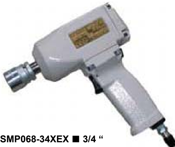
SMP068-34XEX ■ 3/4 “