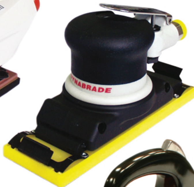
PT-704B2 Base: 70 x 445 mm