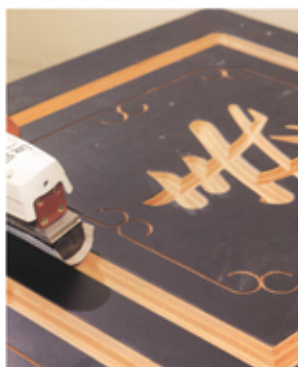
N-LS10 En dotación taco para molduras 35 x 93 mm con fijación adhesiva de lija